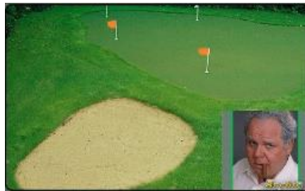
2 oranje vlaggentjes dus 2x stempelen