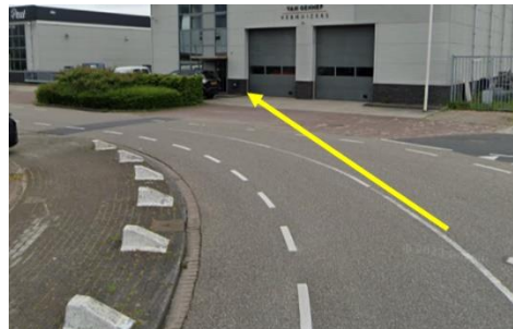
rechtdoorrijder bedrijventerrein in Moordrecht

In opdracht 21 voor brug bij schrikhek asfaltweg L voorzien we achtereenvolgens de foute volgorde van de brug en het schrikhek.