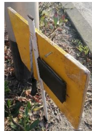
stempel achterkant bord

Bij opdracht 16 na donjon 2 maal R komen we erachter dat we in opdracht 12 t/m 16 bedrijfsterrainen mogen berijden. Een beetje slordig maar de verkeersdrukke op het industrieterrein nodigt niet uit om vanaf opdracht 12 opnieuw te beginnen. Je moet wel eens keuzes maken. Dit was dus geen goede keuze en als "beloning" konden we 30 strafpunten bijschrijven.